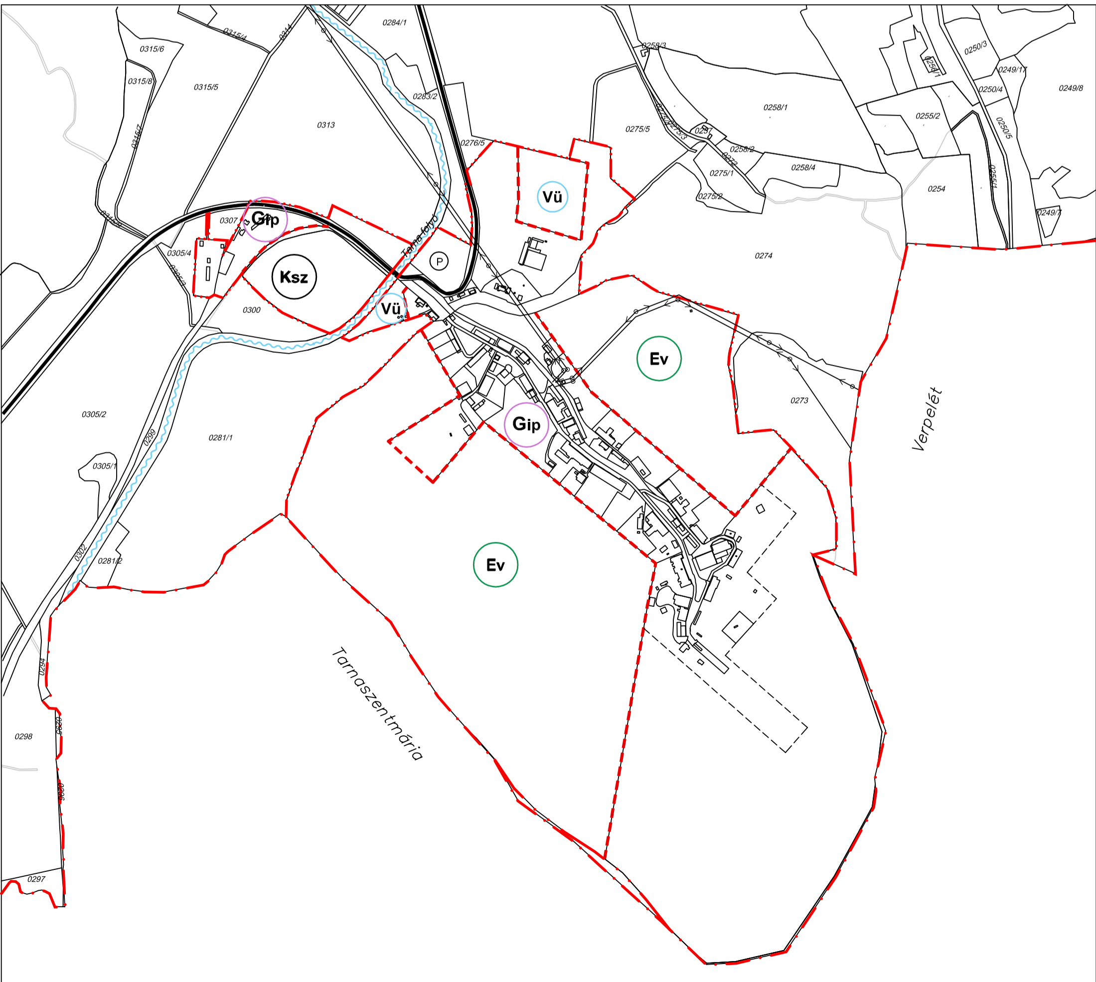
SZABÁLYOZÁSI TERV M = 1:10000